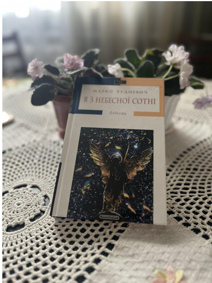
Я з небесної сотні : повість / Марко Рудневич. – К. : А-БА-БА-ГА-ЛА-МА-ГА, 2014. – 192 с.