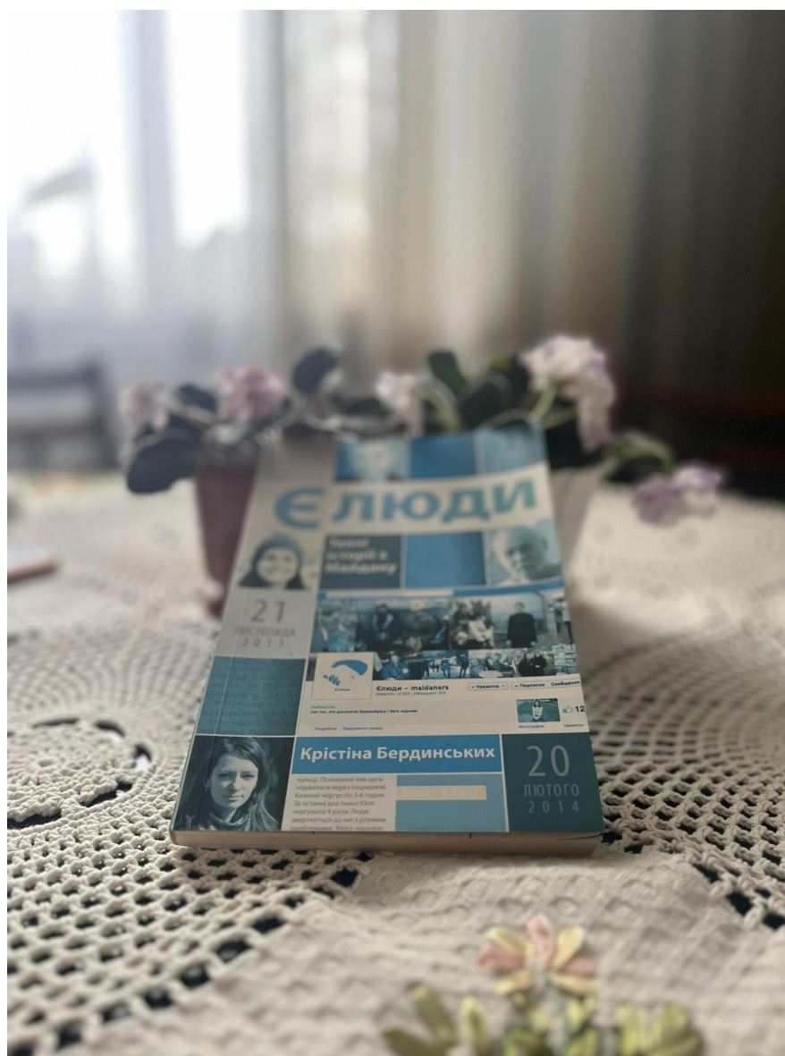
Єлюди: теплі історії з Майдану / Крістіна Бердинських; ред. Ю.Шутенко. – Київ: Брайт Стар Паблішинг, 2014. – 179 с.

До антології «Небесна Сотня» увійшли вірші понад двохсот сучасних письменників з України, Польщі, Білорусі, Франції, Канади, США, а також непрофесійних авторів про революційну боротьбу українців протягом листопада 2014 – лютого 2014 рр. проти тиранічної влади. Втім, не так проти влади, як за своє майбутнє. Ця антологія є першою спробою зібрати, упорядкувати та зберегти майданівські вірші, написані різними мовами. З точки зору літературної та історичної цінності цю книгу, без перебільшення, можна прирівняти до антології Юрія Лавриненка «Розстріляне відродження», адже якщо у 1930-ті роки минулого століття доробок українських сподвижників-письменників не було зібрано в один збірник, то більшість творів було б назавжди втрачено. Безперечно, антологія «Небесна Сотня» гідна високого звання народної книги.